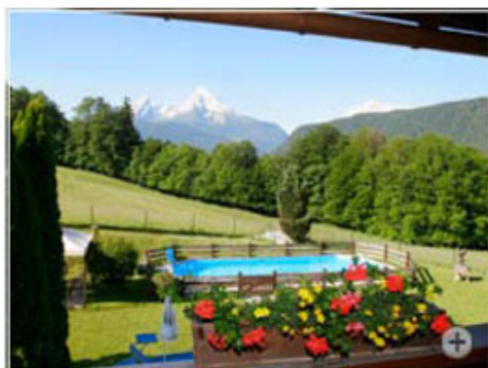
Blick aus dem Watzmannzimmer